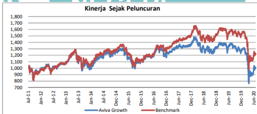
Gambar 1.2 Perbandingan Kinerja Keuangan PT Astra International TBK dengan Benchmark

Dalam CNN (2020) pada 18 November 2020, PT Astra International mengakuisisi PT Astra Aviva Life yang pada saat itu bergerak di bidang asuransi jiwa, kesehatan, kecelakaan dan masih banyak lagi. Aviva Plc memutuskan untuk menjual semua saham yang ada di indonesia. Hal ini dikarenakan adanya dana asing yang tercatat di arus keluar pasar saham sebesar USD339 juta atas penjualan Bank Permata yang menjadi spekulasi dari keluarnya Aviva Holdings dari Astra Life.