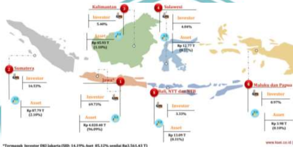
Gambar 1. 4. Peta Jumlah Investor dan Aset

terhadap minat investasi individu terhadap suatu instrumen investasi. Menurut penelitian Arsari & Kurnianingsih (2022) toleransi risiko memiliki pengaruh secara positif dan signifikan generasi milenial terhadap minat berinvestasi di Surakarta. Penelitian itu tidak sepemikiran dengan Baihaqqi & Prajawati (2023) bahwa toleransi risiko tidak berpengaruh secara signifikan dan positif terhadap keputusan investasi mahasiswa.