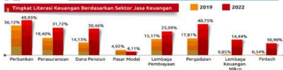
Gambar 1. 3 Tingkat Literasi Keuangan

Dengan adanya peningkatan jumlah investor dipasar modal Indonesia justru tingkat literasi pada pasar modal mengalami penurunan. Artinya meskipun masyarakat berinvestasi, mereka tidak semakin mengerti tentang pasar modal dan produknya sehingga penting untuk meningkatkan kualitas investor (Santi, 2022). Penurunan tingkat literasi di pasar modal terbukti dengan masih banyaknya penipuan berkedok investasi. Rendahnya pemahaman mengenai pasar modal disebabkan karena kesulitan mengakses layanan pasar modal secara digital, ketidakpastian dalam memilih informasi yang kredibel, kurangnya upaya sosialisasi dari lembaga resmi pasar modal, dan informasi yang salah (Phuanerys, Nixon, & Natahsya, 2021).