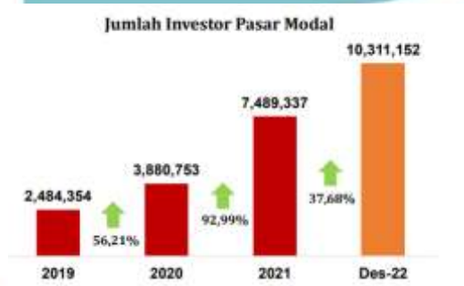
Gambar 1. 1 Statistik Pasar Modal Indonesia 2022

Perkembangan pasar modal yang tinggi merupakan peran para investor yang bertransaksi di Bursa Efek Indonesia. Wadah transaksi bagi yang membutuhkan dana dan yang mengeluarkan dana dengan mengharapkan keuntungan dari kegiatan investasi disebut pasar modal. Investasi merupakan kegiatan mengelola keuangan ataupun sumber dana lain dengan tujuan keuntungan pada masa depan (Handini & Astawinetu, 2020). Dalam pasar modal, terdapat pasar primer dan pasar sekunder. Saham pertama kali diperdagangkan melalui pasar primer atau perdana sebelum memasuki pasar sekunder. Penawaran umum perdana saham oleh perusahaan investor umum atau kepada publik disebut Initial Public Offering (IPO) atau penawaran umum perdana saham sebagai wadah investor bertransaksi dengan memesan saham di sebelum dicatatkan di bursa. Setelah proses transaksi pada saham IPO di pasar perdana, selanjutnya saham perusahaan akan tercatat di bursa efek Indonesia lalu saham itu dapat diperdagangkan pada pasar sekunder (e-IPO, 2023) (Febbiana & Suryono, 2022).