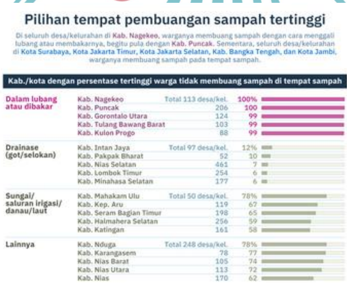
Figure 1. 1 Trash in The Water Ways Data

Water gates are very often clogged with garbage so the water flow is clogged which causes flooding and damages the ecosystem. Therefore, the watergate trash waster functions to deal with this problem. Figure 1.1 shows data which river and waterways are among the most common places for littering. Total of 784 villages where more than 50% average of the residents throws garbage into the river.