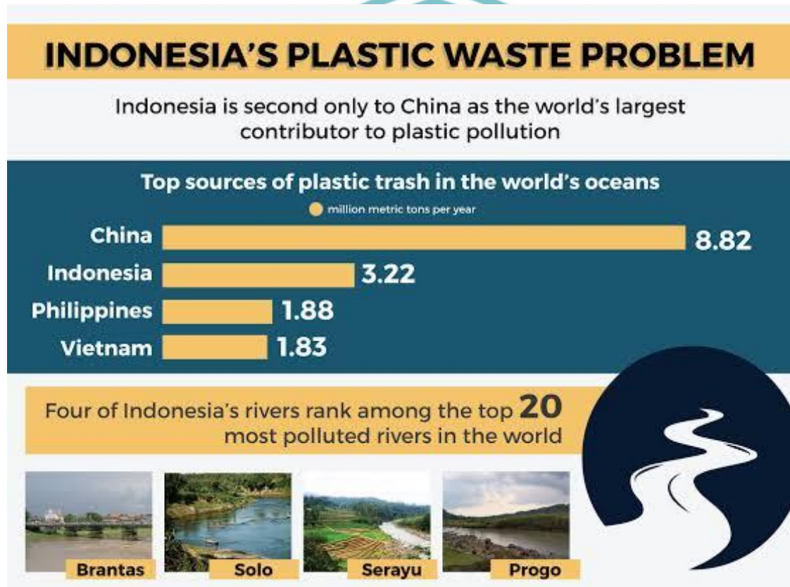
Figure 1. 2 Plastic Waste Problem

Figure 1.2 shows the statistic of plastic waste in the river. The figure shows China, Indonesia, and the Philippines are the top 3 countries that contribute the most plastic waste from rivers in the world. Most of the waste dumped carelessly into rivers is plastic waste.