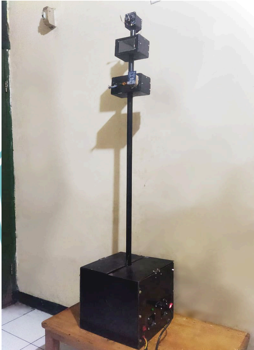
Tampilan Foto Alat Tampak Keseluruhan