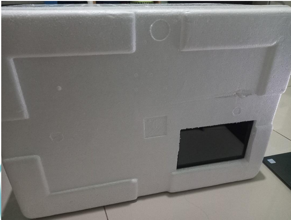
Gambar Alat Keseluruhan